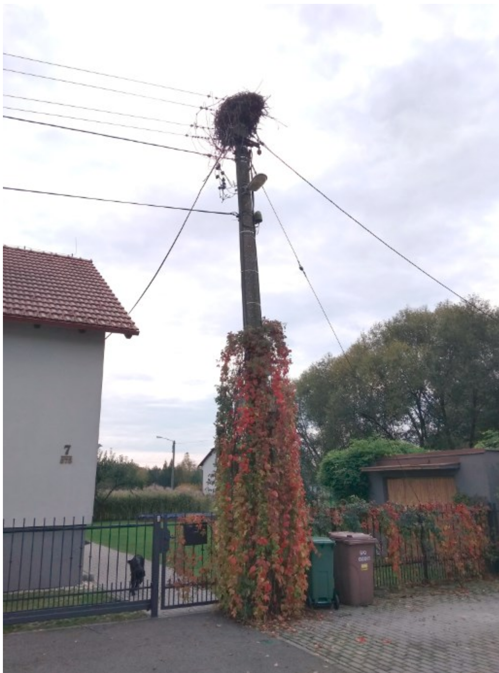
Situační foto sloupu s hnízdem jeho a bezprostředního okolí.