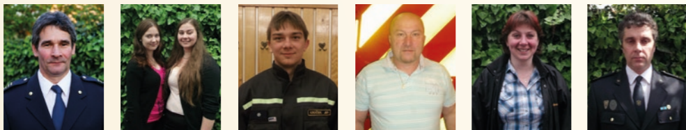
Členové sboru v roce 2016

foto z valné hromady dne 6.5. 2016 u příležitosti sv. Floriana, ve spodní řadě "opozdílci"