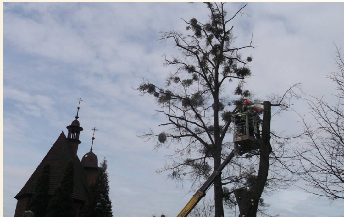
Již několik let zásahová jednotka provádí mj. tzv. „Odstranění nebezpečných stavů“. Na snímku kácení stromů u kostela v Hrabové.