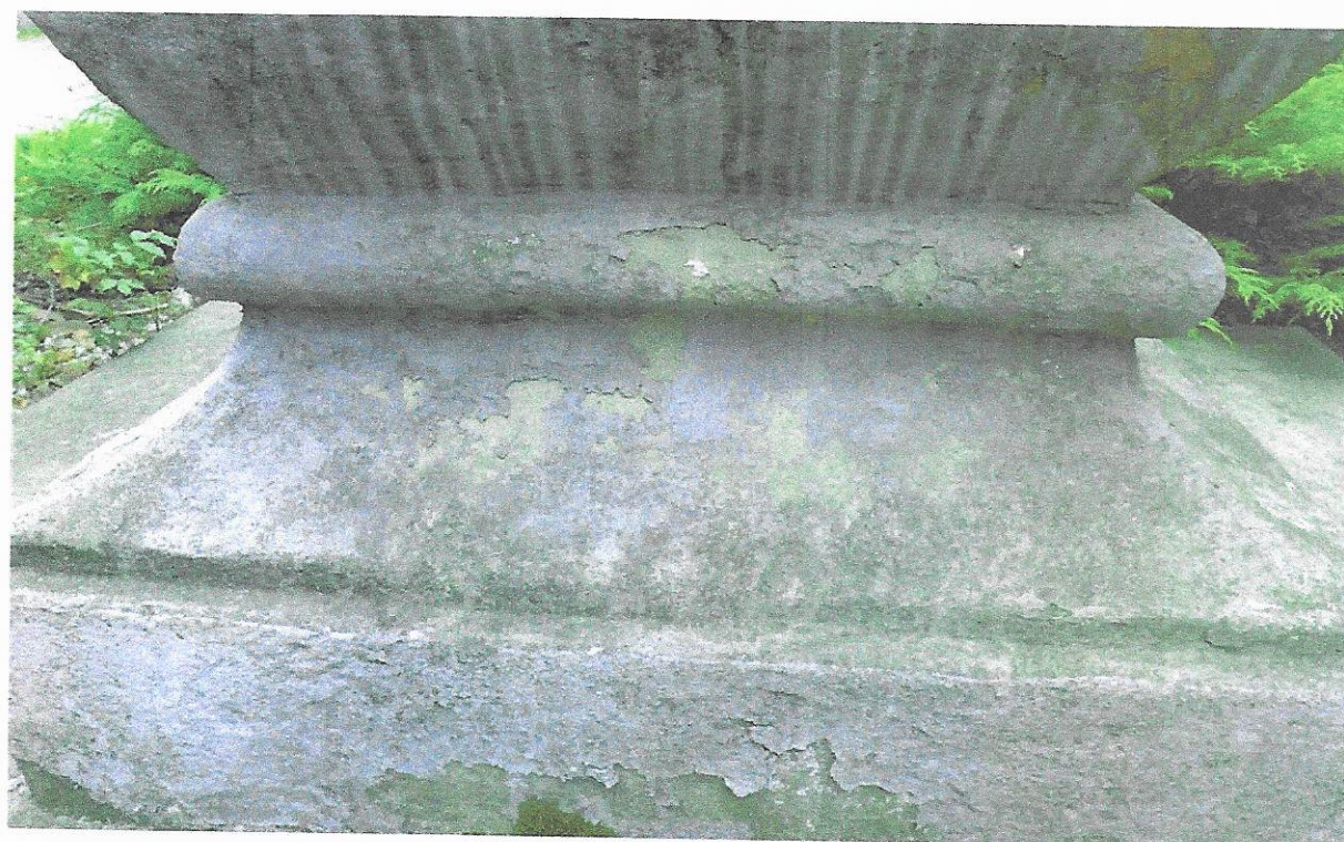
Současný stav Silné znečištění povrchu druhotným monochromním nátěrem, projevy degradace