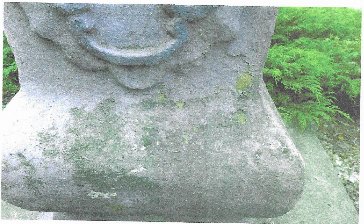
Současný stav Silné znečištění povrchu druhotným monochromním nátěrem, projevy degradace