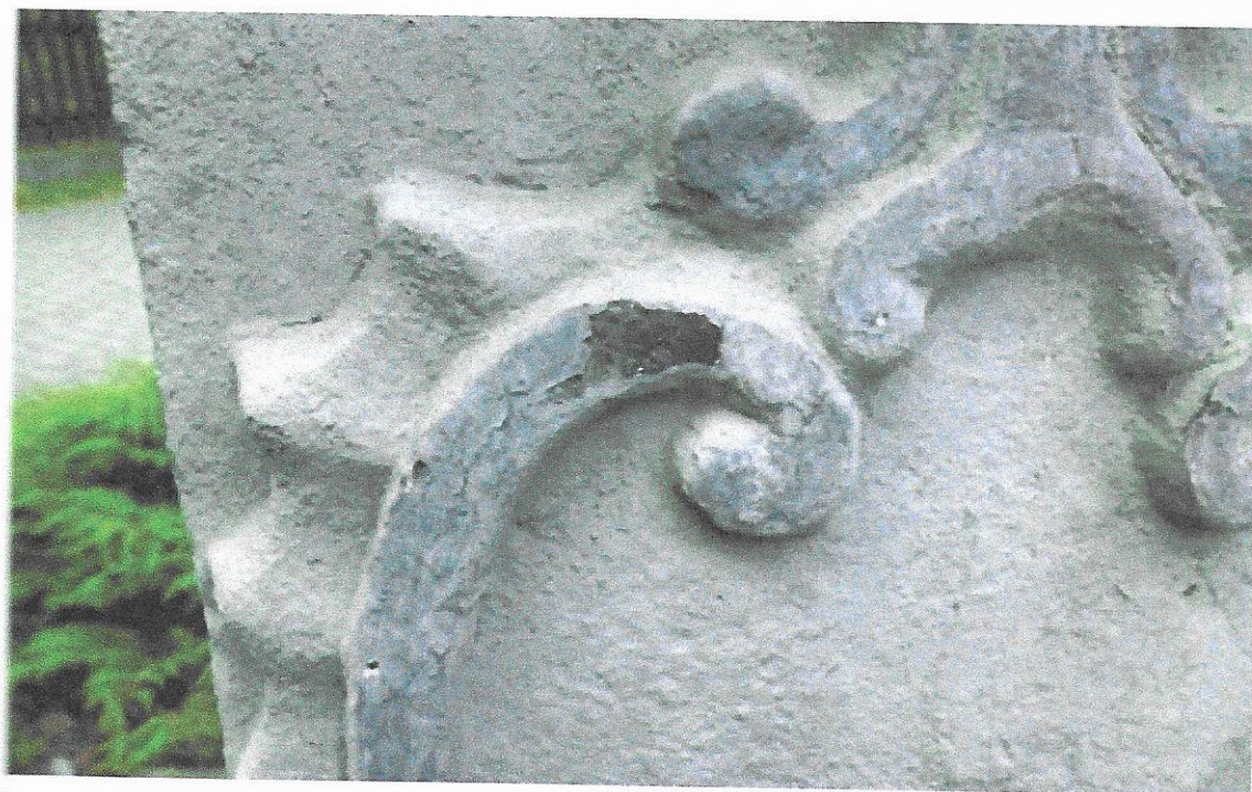
Současný stav Silné znečištění povrchu druhotným monochromním nátěrem