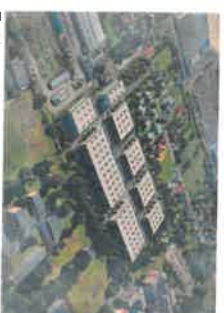
Zastavovací studie CTZone Ostrava Krmelínská